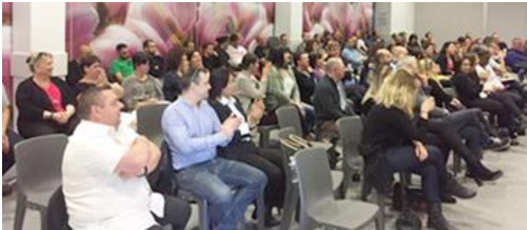
Assemblée Générale de l'UNSA-Postes 69

Avec l'UNSA-POSTES, VOUS n'êtes pas spectateur, mais ACTEUR DE VOTRE AVENIR . Nos représentants syndicaux sont là pour faire entendre VOTRE VOIX .